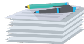
Entrega de ponencia en extenso Hasta el 30 de septiembre