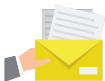
Recepción de resúmen Hasta el 1 de agosto